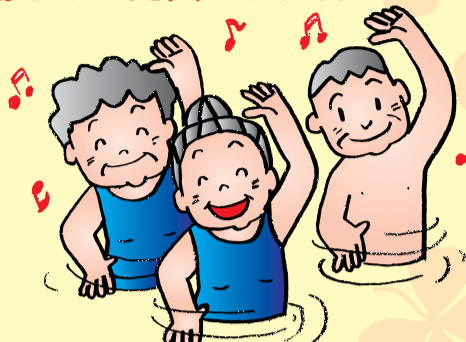
水中運動 (プールを利用した筋トレ及び水中運動)