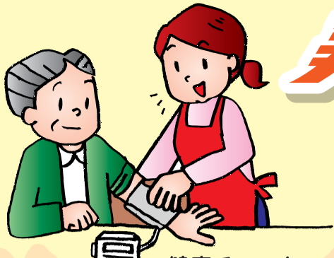
健康チェック (体温・脈拍・血圧などチェック)

みんな集まり、元気に楽しんでいます! ルーム内での運動やゲーム、またピクニックや プールでの水中運動などで元気アップ!!